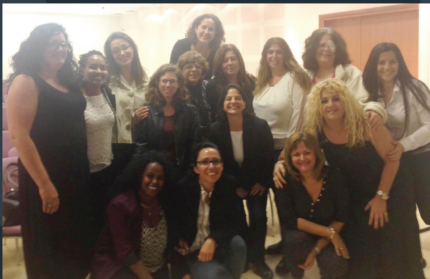
בתמונה: חברות מועצת נשים, מאי 2015